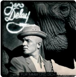
Jan Delay Für Immer und Dich